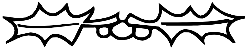
Garderie / Cantine / Foyer -Club