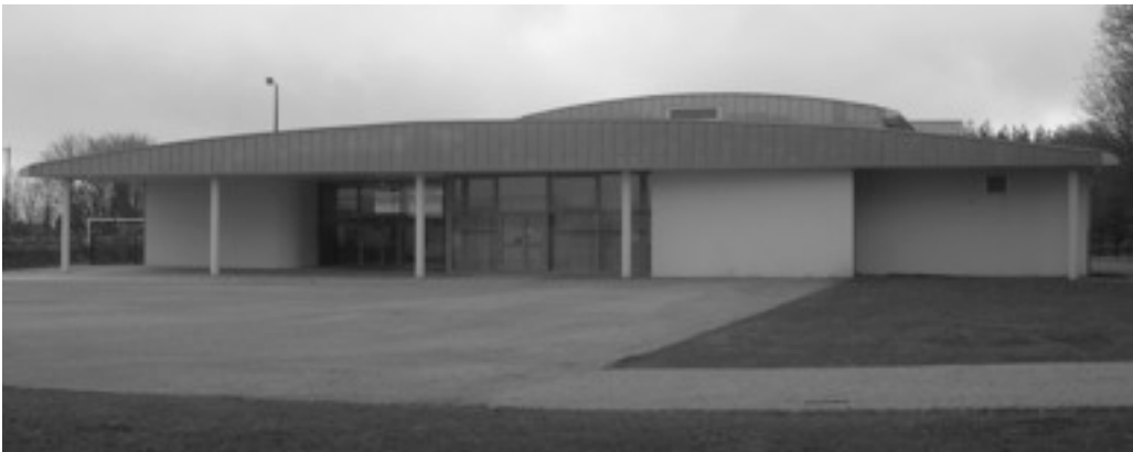
Salle Polyvalente du Valy-Ledan